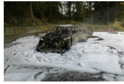
Pkw brennt nahe Bademühlen völlig aus