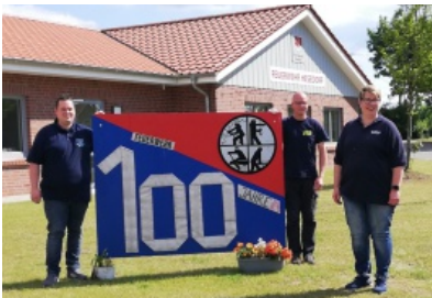
100 Jahre ehrenamtliches Engagement zum Wohle der Bürger