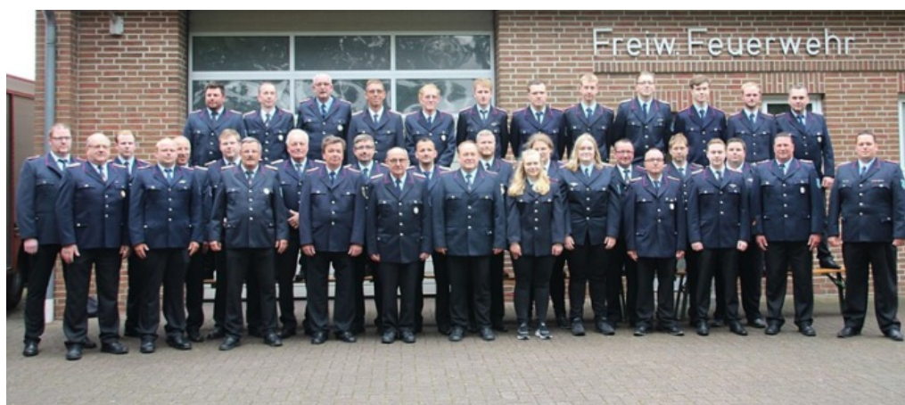
Aus den Feuerwehren

Die Feuerwehrleute sind ausbildungstechnisch auf dem aktuellen Stand, nehmen regelmäßig an Aus- und Weiterbildungsmaßnahmen teil.