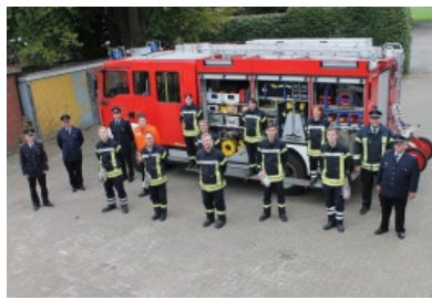
Truppmann Teil 1 in Sittensen erfolgreich abgeschlossen