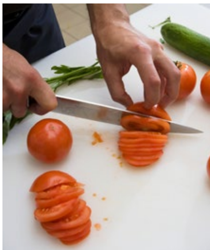
Auch kleine Verletzungen müssen dokumentiert werden.

Die Angaben dienen als Nachweis, dass die Verletzung/Erkrankung durch eine versicherte Tätigkeit verursacht worden ist. Diese Aufzeichnungen können sehr wichtig sein, wenn z. B. Spätfolgen eintreten sollten, denn dann kann im Einzelfall der Nachweis für das Vorliegen eines Feuerwehrdienstunfalls geführt werden, so dass die Kosten für die Leistungen durch die Feuerwehr-Unfallkasse Niedersachsen übernommen werden können. Aber die Aufzeichnungen dieser „nicht meldepflichtigen“ Arbeitsunfälle bieten noch mehr. Sie liefern der Betriebsärztin oder dem Betriebsarzt und der Fachkraft für Arbeitssicherheit wichtige Informationen für Untersuchungen und Auswertungen und sind für die Prävention daher ein wichtiges Tool zur Identifizierung von Unfallschwerpunkten im Betrieb.