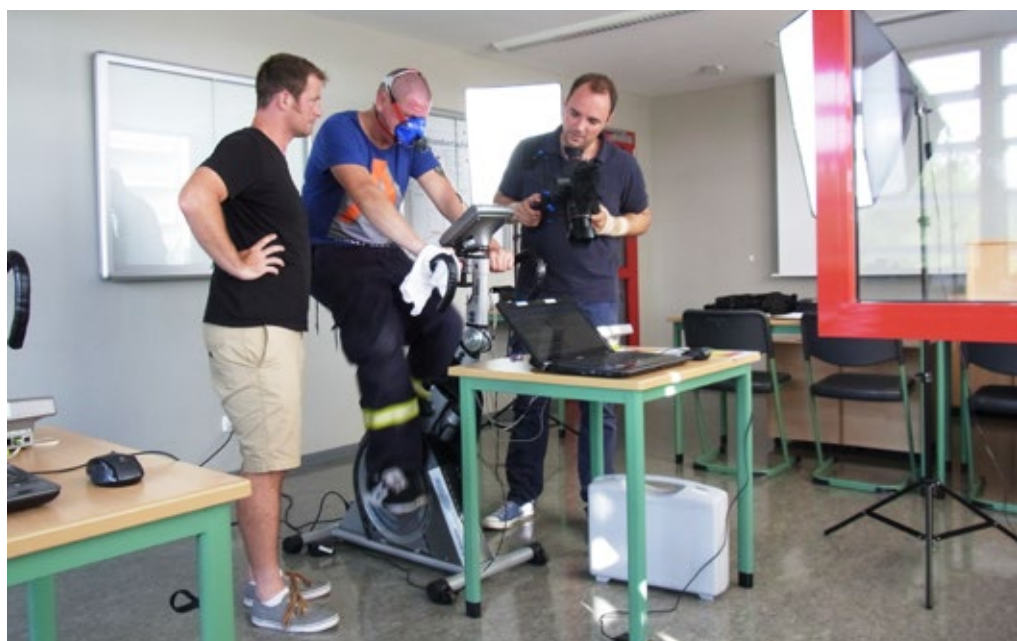
Ergometrie bei der Eignungsuntersuchung