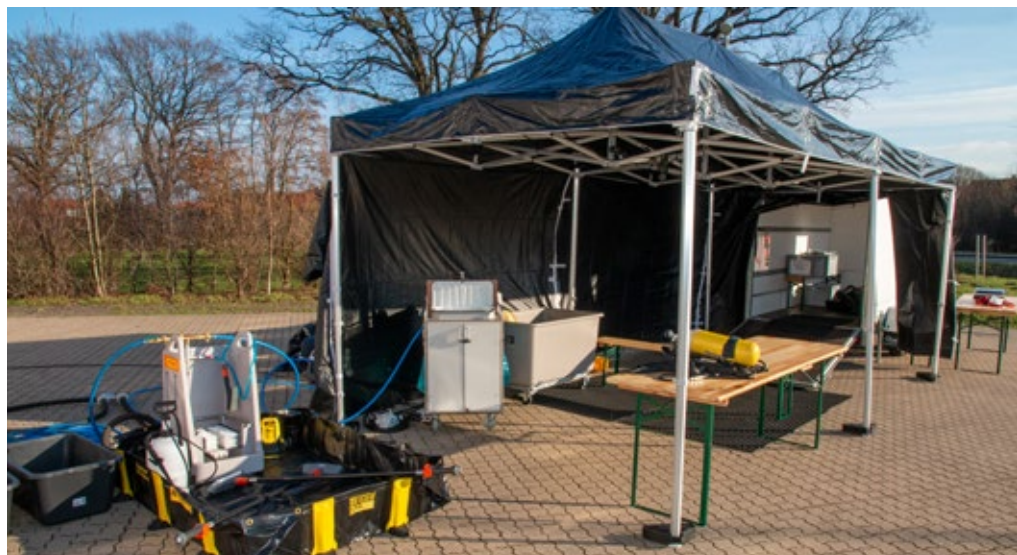
Bild 2: Vor dem Zugang zur Ablage befindet sich der Waschplatz, bevor in den schwarzen Pavillon zur Ablage der kontaminierten PSA gewechselt wird. Der Pavillon ist hier im geöffneten Zustand abgebildet.

verfügt, so dass kein Atemschutzgeräteträger ein zweites Mal eingesetzt werden muss,