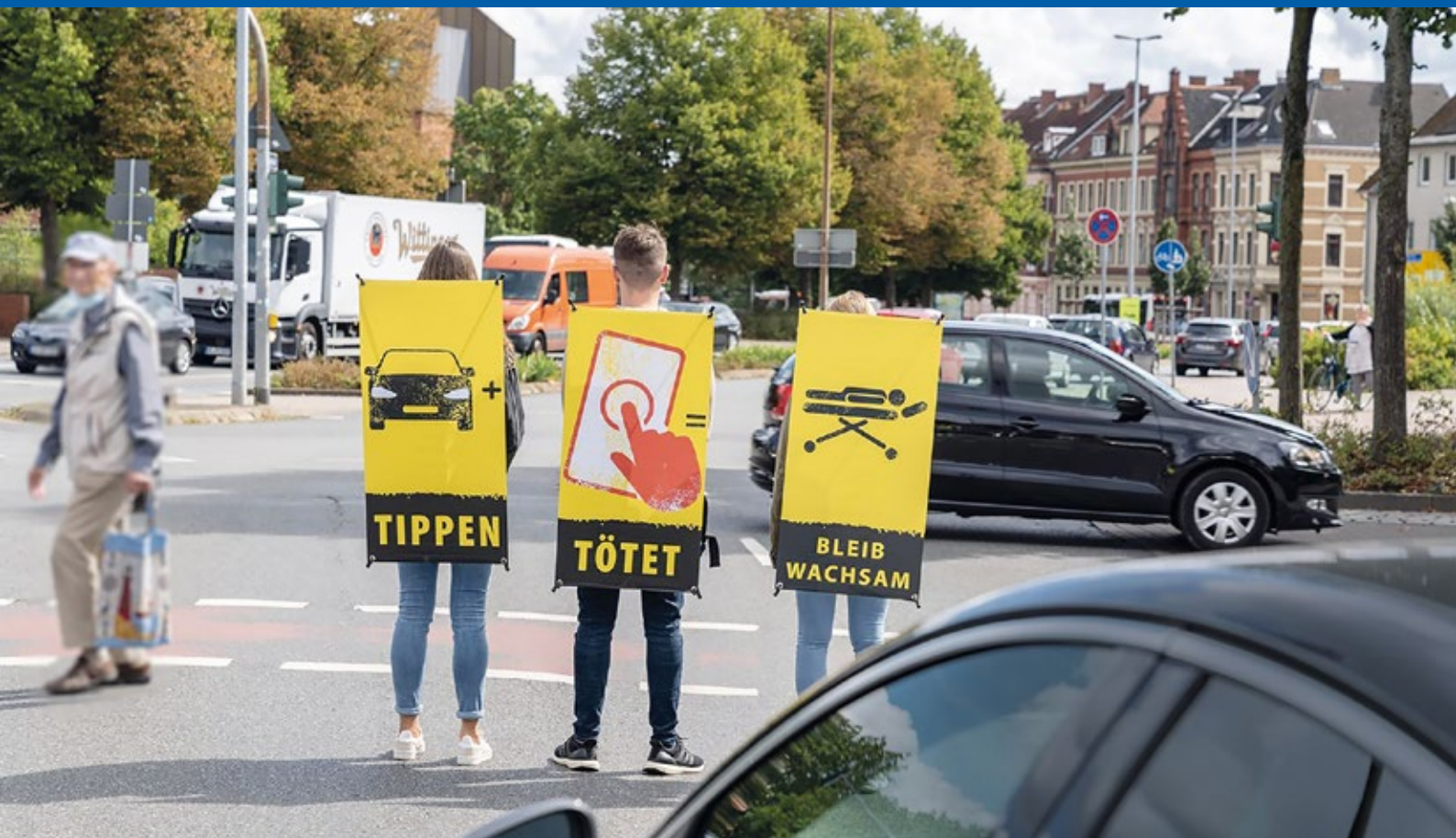
Rucksackaktion aus unserer fortlaufenden Kampagne gegen Ablenkung im Straßenverkehr (fokussiert auf das Smartphone)

Ein besonderer Partner für die Verkehrswachten ist die Polizei in Niedersachsen. „Mit der Polizei sind wir untrennbar verbunden. Durch unsere gemeinsame Arbeit und durch die vielen Polizistinnen und Polizisten, die als Mitglieder in der Verkehrswacht tätig sind.“ In der Coronapandemie, die auch die Arbeit der Landesverkehrswachten temporär beeinträchtigt hat, hat sich die Kraft der Gemeinschaft gezeigt. Ein Beispiel: Ausgefallene Radfahrausbildungen durch geschlossene Schulen konnten vielerorts durch Ferienfahrradschulen von den Verkehrswachten ausgeglichen werden. Sie werden bis zum heutigen Tag fortgeführt, damit jedes Kind in Niedersachsen eine Radfahrausbildung erhalten kann.